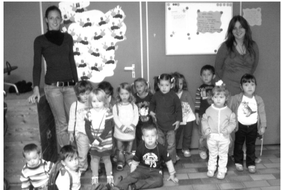
Die Glühwürmchen auf dem Weg in die neue Turnhalle