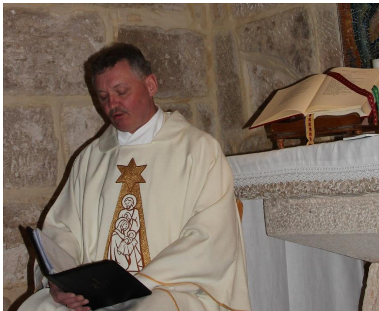
Gottesdienst in Betlehem

In diesem Sinne Ihnen und uns allen einen gesegneten Heiligen Abend und eine frohe, gnadenreiche Weihnacht! Amen.