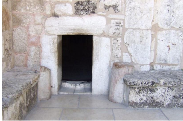
Eingang Geburtskirche Betlehem

plötzlich unverhofft mitten im kalten winter in der nacht in einem milieu wo man es nicht vermutete in einer gegend ... die ... ja die gegend betlehems felder wissen sie wo das ist da ganz am rand der welt da hat der himmel die erde geküsst