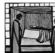
Ostersonntag: Sein Leben feiern