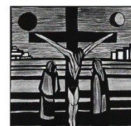
Karfreitag: Sein Leiden mittragen