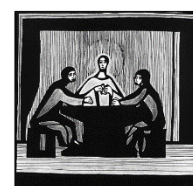
Ostermontag: Seiner Gegen- wart trauen